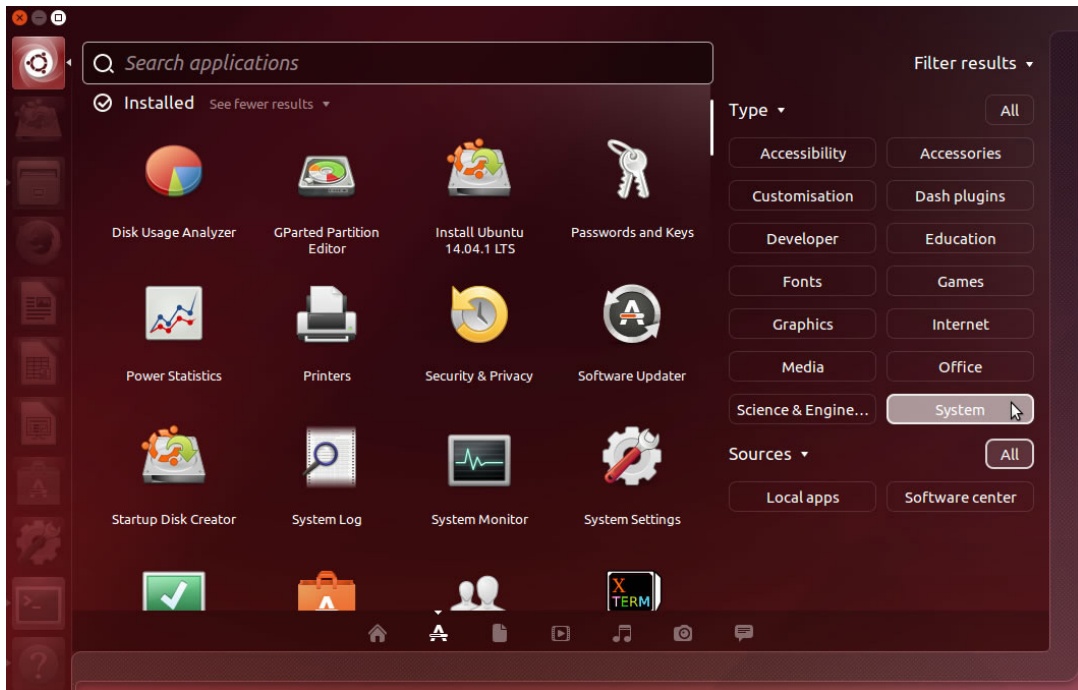
Ubuntu com a interface Unity. 4