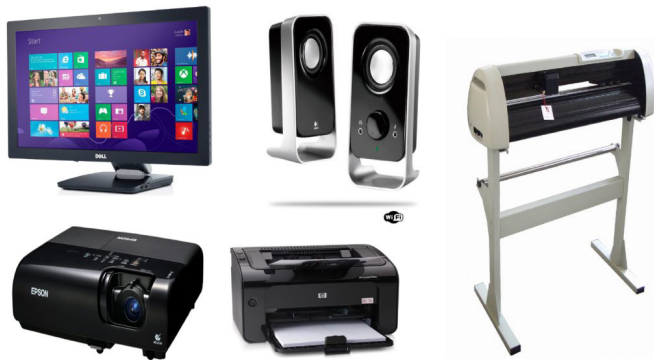
Periféricos de saída. 9

– Periféricos de saída: São aqueles que recebem informações do computador. Ex.: monitor, impressora, caixas de som.