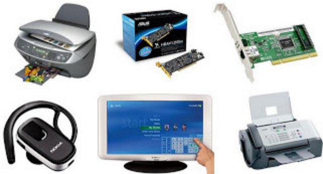
Periféricos de entrada e saída. 10

– Periféricos de entrada e saída: são aqueles que enviam e recebem informações para/do computador. Ex.: monitor touchscreen, drive de CD – DVD, HD externo, pen drive, impressora multifuncional, etc.