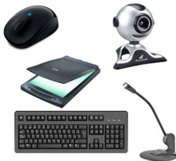
Periféricos de entrada. 8

– Periféricos de entrada: são aqueles que enviam informações para o computador. Ex.: teclado, mouse, scanner, microfone, etc.