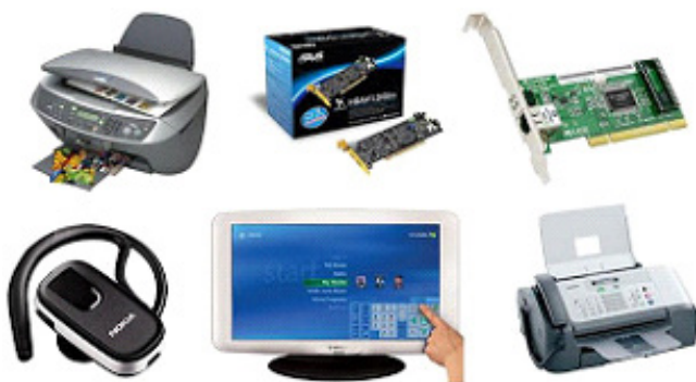
Periféricos de entrada e saída. 10

– Periféricos de entrada e saída: são aqueles que enviam e recebem informações para/do computador. Ex.: monitor touchscreen, drive de CD – DVD, HD externo, pen drive, impressora multifuncional, etc.