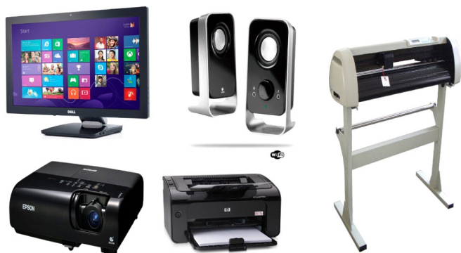
Periféricos de saída. 9

– Periféricos de saída: São aqueles que recebem informações do computador. Ex.: monitor, impressora, caixas de som.