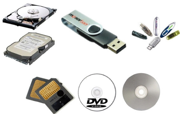
Periféricos de armazenamento. 11

– Periféricos de armazenamento: são aqueles que armazenam informações. Ex.: pen drive, cartão de memória, HD externo, etc.