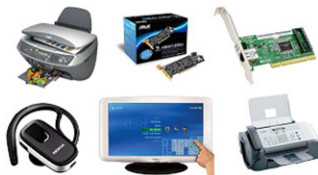
Periféricos de entrada e saída

– Periféricos de entrada e saída: Dispositivos que podem receber dados do computador e enviar dados para ele, como drives de disco, monitores touchscreen e modems.