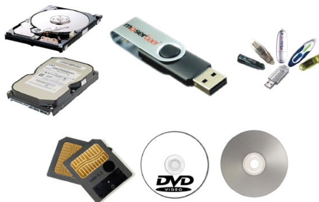
Periféricos de armazenamento

– Periféricos de armazenamento: dispositivos usados para armazenar dados de forma permanente ou temporária, como discos rígidos, SSDs, CDs, DVDs e pen drives.