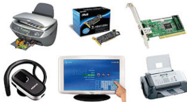
Periféricos de entrada e saída

– Periféricos de entrada e saída: Dispositivos que podem receber dados do computador e enviar dados para ele, como drives de disco, monitores touchscreen e modems.