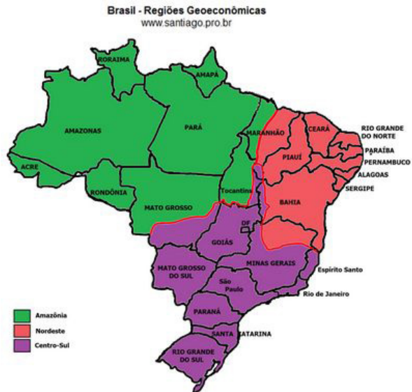
Elaborado por: Santiago Alves de Siqueira - www.santiago.pro.br http://www.geografia.seed.pr.gov.br/modules/galeria/uploads/5/normal_brasilgeoeconomico.jpg

Os limites da Amazônia correspondem à área de cobertura original da Floresta Amazônica. Essa região é caracterizada pelo baixo índice de ocupação humana e pelo extrativismo vegetal e mineral.