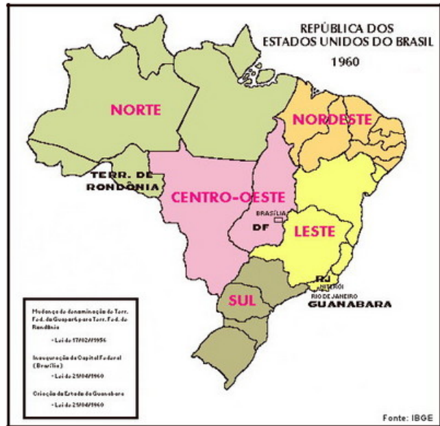
Regionalização do Brasil → década de 1960

http://www.geografia.seed.pr.gov.br/modules/galeria/detalhe.php?foto=1560&evento=5