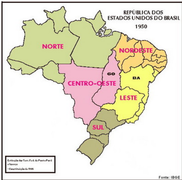
Regionalização do Brasil → década de 1950

http://www.geografia.seed.pr.gov.br/modules/galeria/detalhe.php?foto=1558&evento=5