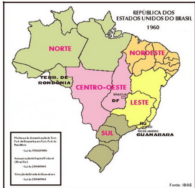
Regionalização do Brasil → década de 1960

http://www.geografia.seed.pr.gov.br/modules/galeria/detalhe.php?foto=1560&evento=5