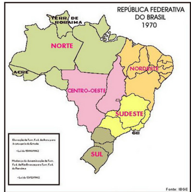
Regionalização do Brasil → década de 1970

http://www.geografia.seed.pr.gov.br/modules/galeria/detalhe.php?foto=1561&evento=5