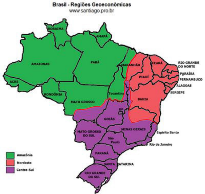
Elaborado por: Santiago Alves de Siqueira - www.santiago.pro.br http://www.geografia.seed.pr.gov.br/modules/galeria/uploads/5/normal_brasilgeoeconomico.jpg

Os limites da Amazônia correspondem à área de cobertura original da Floresta Amazônica. Essa região é caracterizada pelo baixo índice de ocupação humana e pelo extrativismo vegetal e mineral.