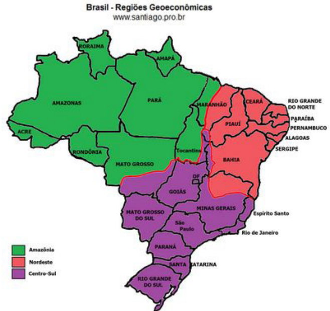
Elaborado por: Santiago Alves de Siqueira - www.santiago.pro.br

http://www.geografia.seed.pr.gov.br/modules/galeria/uploads/5/normal_brasilgeoeconomico.jpg