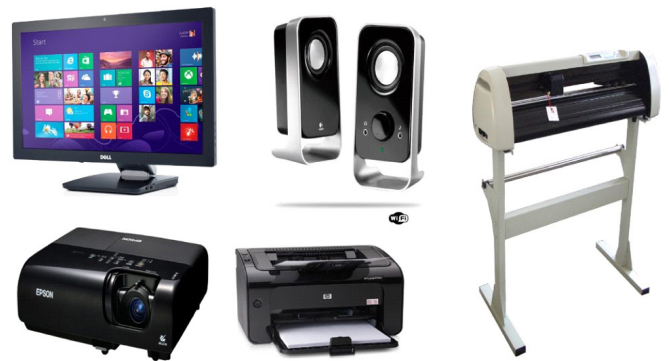
Periféricos de saída

– Periféricos de saída: Dispositivos que permitem ao computador transmitir dados para o usuário, como monitores, impressoras e alto-falantes.